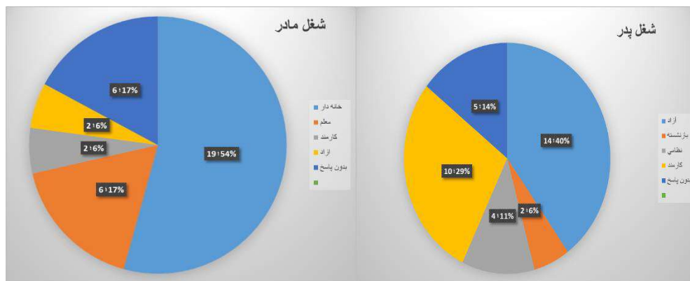
نمودار شماره ۱: سیمای شرکت کنندگان پژوهش بر اساس شغل پدر / نمودار شماره ۲: سیمای شرکت کنندگان پژوهش بر اساس شغل مادر

همچنین مدرک تحصیلی والدین به شرح جدول زیر است ➤