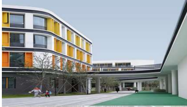
شکل ۳: راهروها و محل عبور عریض متأثر از پست مدرن

این طرح، ابعاد مسیر تردد گسترده تر شده و به ۳/۶ متر رسیده است. به این صورت فضاهای خاکستری متعدد که فاقد مرزهای مشخص هستند به وجود می آید که هم دسترسی آسان داشته و به علاوه در مجاورت کلاسها هستند و می توانند مشوق دانش آموزان باشند تا به صورت خلاقانه این فضاها را کشف کرده و از آنها استفاده کنند.