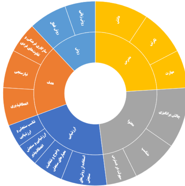
شکل ۲: الگوی نهایی