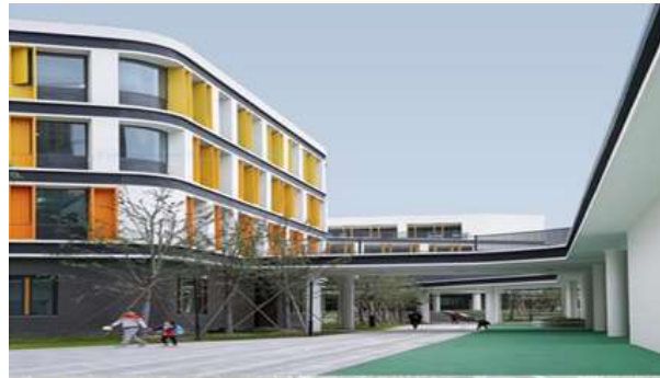
شکل ۳: راهروها و محل عبور عریض متأثر از پست مدرن

این طرح، ابعاد مسیر تردد گسترده تر شده و به 3/6 متر رسیده است. به این صورت فضاهای خاکستری متعدد که فاقد مرزهای مشخص هستند به وجود می آید که هم دسترسی آسان داشته و به علاوه در مجاورت کلاسها هستند و می توانند مشوق دانش آموزان باشند تا به صورت خلاقانه این فضاها را کشف کرده و از آنها استفاده کنند.