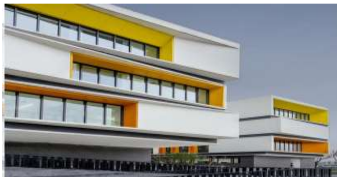
شکل ۴: موقعیت قرارگیری نمای مدرسه ۳۶ کلاسه متأثر از پست مدرنیسم

طرح ارائه شده برای نما در راستای طرح حجم در ترازهای مختلف بوده و با سادگی جهان مدرن در هم می آمیزد. به دلیل نور طبیعی فراوانی که به بناهای این مجموعه راه پیدا می کند، نیاز به نور مصنوعی کاهش یافته و در مصرف انرژی صرفه جویی می شود. بازشوهای آلومینیومی رنگی سیرکولاسیون جریان هوا و ورود هوای تازه به فضای داخل را تسهیل می کنند. نحوه طراحی فریم پنجره ها به گونه ای بوده است که نه تنها از یک سو در تهویه فضای داخلی مؤثر بوده بلکه به علاوه از قسمت مسیرهای تردد نقش و ریتم منحصر به فردی را به نمایش می گذارند. بنابراین در طرح بنا نوعی وحدت به وجود آمده و درک و تجربه این فضا توسط کاربران از قسمت راهروها و محل گذر، غنی تر شده است.