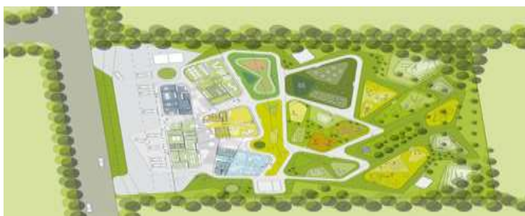
شکل ۷: سایت پلان مهد کودک

شکل نامنظم ساختمان با مساحت ۱۲۰۰ متر مربع نتیجه کاربرد این فلسفه معماری در آموزش است: «استفاده از ساختمان باید آموزشی باشد، چرا که ما بیشتر از به کار گرفتن ویژگیهای ساختمانهای معمولی اجتناب می کنیم». بچه ها باید از مراحل اولیه یاد