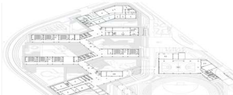
شکل ۲: پلان مدرسه ۳۶ کلاسه متاثر از پست مدرن

جهت ایجاد تضاد با محیط مسکونی پرتراکم اطراف این بنا، معماران از ابتدا در نظر گرفتند که فضای آموزشی را تا حد امکان متمرکز و فشرده طراحی کنند تا فضای آزاد برای فعالیت های خارجی و فضاهای باز به حداکثر برسد. در داخل محوطه شیب سبزی با ارتفاع ۱٫۵ متر در قسمت شمال غربی به وجود آمده که برای ایجاد آن از محصول عملیات خاکی احداث پارکینگ، در زیر قسمت زمین دو و میدانی، استفاده شده است. این ایده علاوه بر این که در عملیات خاکی توازن به وجود آورده است، به علاوه باعث شده بناهای اصلی این فضای آموزشی به صورت سیال بر روی این شیب سبز اکولوژیکی قرار گرفته و این گونه موقعیت مکانی فضاهای آموزشی و ورزشی تعریف مشخصی پیدا کند. بناهایی که بالاتر از تراز همکف قرار دارند با فضاهای باز، مانند زمین دو و میدانی ارتباط عمودی برقرار کرده و شرایط بصری مناسبی را برای معلمان و دانش آموزان فراهم می کنند تا در طول زمانی که در کلاس حضور دارند، بتوانند عرصه مسابقات دو و میدانی را نیز مشاهده کنند.