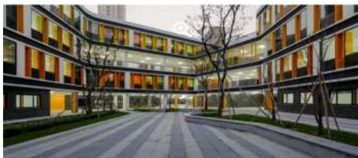
شکل ۱: نمای خارجی مدرسه ۳۶ کلاسه متاثر از پست مدرن

جهت ایجاد تضاد با محیط مسکونی پرتراکم اطراف این بنا، معماران از ابتدا در نظر گرفتند که فضای آموزشی را تا حد امکان متمرکز و فشرده طراحی کنند تا فضای آزاد برای فعالیت های خارجی و فضاهای باز به حداکثر برسد. در داخل محوطه شیب سبزی با ارتفاع ۱٫۵ متر در قسمت شمال غربی به وجود آمده که برای ایجاد آن از محصول عملیات خاکی احداث پارکینگ، در زیر قسمت زمین دو و میدانی، استفاده شده است. این ایده علاوه بر این که در عملیات خاکی توازن به وجود آورده است، به علاوه باعث شده بناهای اصلی این فضای آموزشی به صورت سیال بر روی این شیب سبز اکولوژیکی قرار گرفته و این گونه موقعیت مکانی فضاهای آموزشی و ورزشی تعریف مشخصی پیدا کند. بناهایی که بالاتر از تراز همکف قرار دارند با فضاهای باز، مانند زمین دو و میدانی ارتباط عمودی برقرار کرده و شرایط بصری مناسبی را برای معلمان و دانش آموزان فراهم می کنند تا در طول زمانی که در کلاس حضور دارند، بتوانند عرصه مسابقات دو و میدانی را نیز مشاهده کنند.