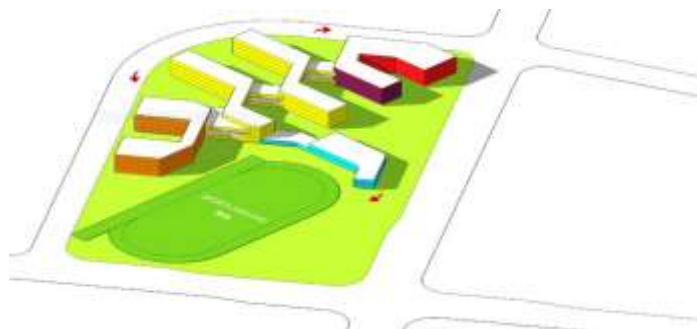
شکل ۵: بکارگیری رنگ در فضای و نمای مدرسه با توجه به روحیات بچه ها